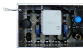
Sterownik automatycznego nawadniania BM4 Nr Art. 4045