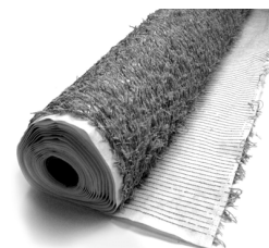
Włóknina podsiąkowa DV 40 Nr Art. 2160/2165