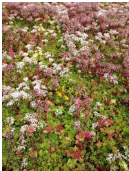
Dywan z rozchodnika

W swojej ofercie posiadamy standardowe rodzaje mat: maty z rozchodnikami, maty z roślinami tworzącymi łąkę kwietną i maty z mieszanką rozchodników i ziół. Maty te różnią się gatunkami roślin.