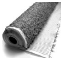
Włóknina podsiąkowa DV 40 Nr Art. 2160-2165