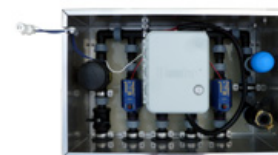
Sterownik automatycznego nawadniania BM4 Nr Art. 4045