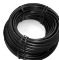
Linia kroplująca 100-L1 Nr Art. 9310